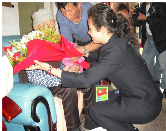
强国之路，青春使命。绿海学子在金寨开展“三下乡”活动时，看望102岁老红军，并献上鲜花