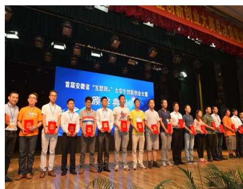
学子在安徽省“互联网+”大学生创新创业大赛中获佳绩