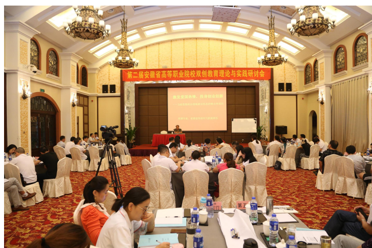
双创联盟举办多届师资培训