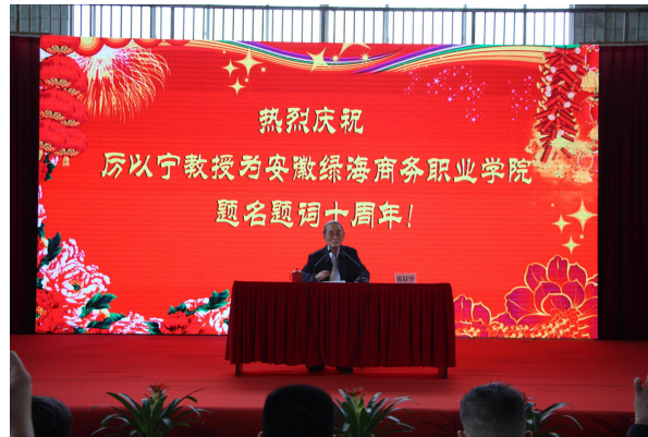
北京大学光华管理学院名誉院长、著名经济学家厉以宁教授为绿海学院题名题词，亲临绿海学院看望慰问师生，并作“工匠精神的诞生与发展”主题报告