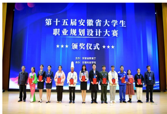
学子荣获第十五届安徽省大学生职业规划设计大赛总决赛一等奖

98.5%以上，就业质量稳步提升。学院“星青年志愿团”多次作为我省唯一的高职院校志愿团队受邀参与服务，荣获“安徽青年志愿者优秀组织奖”、获上海世博局授予“最佳志愿团队”等多项荣誉称号，多次受到共青团合肥市委及历届赛会组委会的慰问表彰。