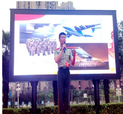
“学党史、颂党恩、跟党走”主题演讲比赛