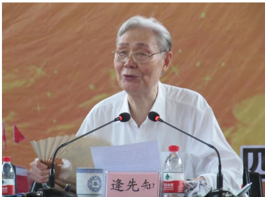
在毛泽东身边工作 17 年的著名党史专家、中共中央文献研究室原主任逢先知编写《毛泽东年谱》，并亲自来绿海学院为师生作“毛泽东年谱教育”主题报告