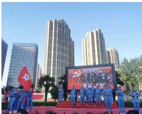
“百年党史，传承红色基因”经典诵读比赛

学院每年开展纪念五四运动“强国之路，青春使命”等系列红色文化主题教育活动。深入开展党史宣讲、红歌合唱、党史主题演讲等党史学习教育活动。学院精选金寨红军广场等作为师生学党史、悟思想、学楷模、强信念的重要思政课校外基地，定期开展实践活动。学院按照三年六学期学段进程，设计开展“爱国、守纪、勤学、感恩、诚信、笃行、敬业”主题教育。坚持每周一举行国旗升旗仪式，并不断丰富仪式的形式与内涵。组织千名师生开展《为职教礼赞，立星青年誓言》专题片拍摄活动，师生在活动中接受红色文化熏陶，坚定理想信念，在参与拍摄中磨炼意志品质，增强职教意义认知、职教价值自信、职业认同以及“强职有我、强国有我”的自信心和责任感。以此培养学生的家国情怀、人文情怀和世界胸怀，激励学生爱党爱国、坚守理想、守纪好学、艰苦奋斗、诚实做人、学会感恩、爱岗敬业。有效增强了学生的理想信念。