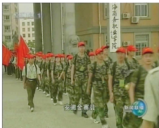
2009年5月4日，中央电视台《新闻联播》报道绿海学院坚持理想信念教育，着力培养时代星青年

学院在“三全育人”工作中的形成的一系列理论创新和实践成果，受到社会的积极关注、广泛赞誉和充分肯定。中央电视台、《光明日报》《中国教育报》《中国青年报》《新安晚报》等主流媒体多次进行报道。学院组织开展的红色文化育人，拍摄的《为职教礼赞，立星青年誓言》专题片，在学习强国、《中国日报》、人民网、新华网、中国网、中国教育电视台、《香港大公报》、凤凰新闻等主流媒体宣传推广。“三全育人”工作取得了良好的育人成效和社会影响。