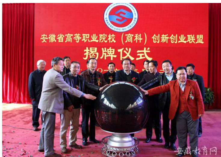
学院牵头成立安徽省高等院校双创联盟

学院与南京诚明书院、江苏固得电子公司，浙江方太集团、国家行政学院“中华优秀传统文化实践课题组”等合作成立“三全育人”创新研究中心。牵头成立了安徽省当代社会主义核心价值体系研究中心、安徽省高等职业院校创新创业联盟、安徽省红色文化研究工作委员会三大省级综合平台。其中，“研究中心”提出的“一个中心，六个结合”、指导创办的《思政云参》，有力推动了培育和践行社会主义核心价值观落实、落细、落小和思政课改革创新。“双创联盟”规划的双创教育“十大目标、五大课程、四大赛事”，激发了学院双创教育的生机活力。与国家双创委联合举办“高职院校双创师资培训班”，有效促进了双创师资队伍建设。“红研会”遴选的“百个红色经典、十大实践基地、五个活动项目”，对指导学院传承红色文化发挥了重要作用。