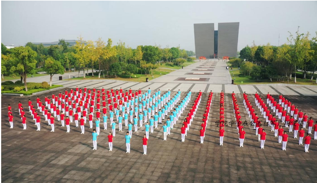
学院学子在金寨红军广场宣誓