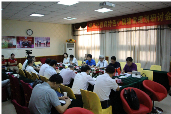
当代儒学大师吴光教授，曾为习近平总书记作国学讲座。多次亲临绿海学院，就三全育人、文化兴校予以指导