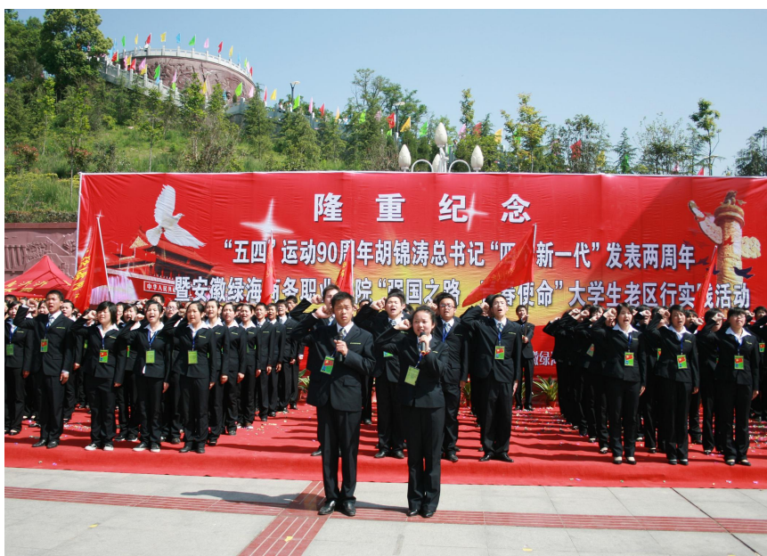
“强国之路 青春使命”，绿海学子在金寨县红军广场上宣读《学生宣言》